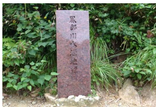
写真1. 黒部川水源地標の写真