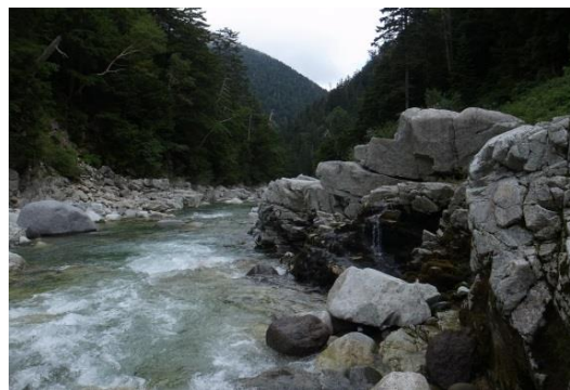
写真2. 薬師沢小屋近くの源流