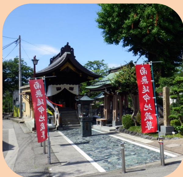
富山市石倉町の延命地藏尊

富山市街を流れる「いたち川」沿いには、延命地藏尊がいくつも祀られています。安政5年(1858)に発生した飛越地震の際、立山連峰の一部が大崩落し、溜まった土砂がもとで常願寺川が大洪水を起こしました。多くの死者や病人が出たなか、川からお地藏様を引き上げて奉ったところ病人が救われたと伝わっています。祠の脇には地下水が湧き出しています。ここは常願寺川がつくった扇状地の先端部にあたり、立山の豊富な雪のおかげで年中絶えず湧き出しています。この地は、今も昔も遠く離れた立山や常願寺川と深く関わっています。大地と人との関わりがみられる場所として、立山黒部ジオパークのノンジオサイトに指定されています。