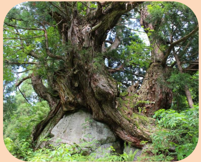
南又谷の洞杉(魚津市)

富山湾から27kmと短い距離を2,400mの高さから一気に流れ下る片貝川は、日本屈指の急流河川となっています。このため、ひとたび大雨が降れば、川は濁流となり、巨大な岩石が山から流れ下ります。片貝川の上流、標高500mから700mの南又谷の山中にも、大きな転石を幾つも見ることができます。この岩石を抱くように巨大なスギが群生しています。幹の内部が空洞になっていることから、「洞杉」と呼ばれ、その幹周りは15.6mに達するものもあります。雪が多く根元から枝々が横に広がっていることも特徴であり、その堂々とした姿は圧巻です。雪と石とが織り成すジオパークの光景です。