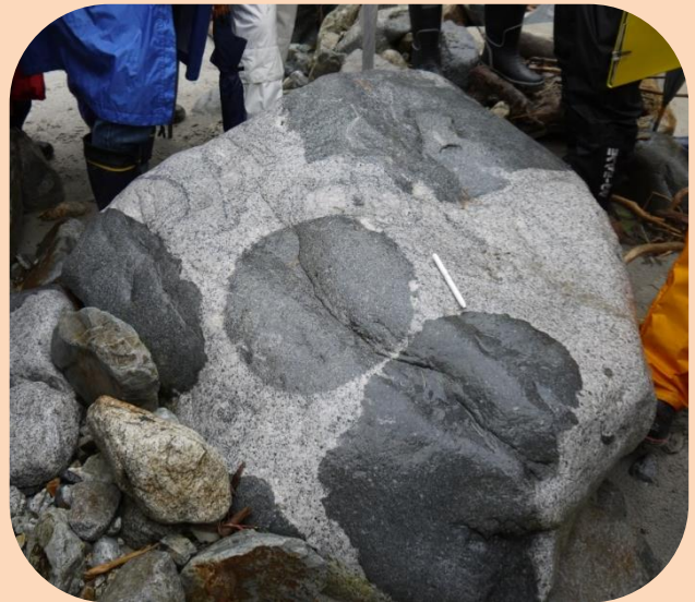
祖母谷温泉近くで見える黒部川花崗岩

風林火山の一説には「動かざること山のごとし」とありますが、実は飛騨山脈は驚くほど動いています。それを象徴するものは、パンダ模様の「黒部川花崗岩」で、黒部峡谷の樺平から黒部ダムあたりの東側に分布しています。通常、花崗岩とは地下数キロでゆっくりと冷え固まってできる岩石で、地表には数千万年より古いものが多くあります。しかしこの花崗岩は、その100倍も新しい80万年前の世界一新しい花崗岩です。つまりこの岩石は、80万年の間に数千メートルの距離を上昇したことになります。黒部川花崗岩は、飛騨山脈が急激に隆起し、黒部川によって激しく侵食された結果地表に現れた、大地の変動を示す証拠なのです。